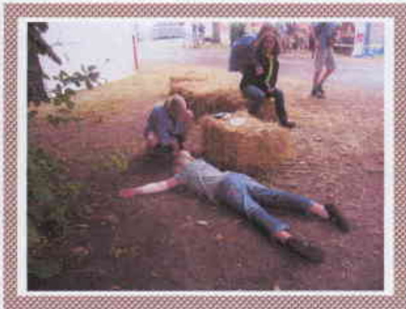
EINE ZIMLICH GROÙE VERLETZUNG NEBEN DER BANG.