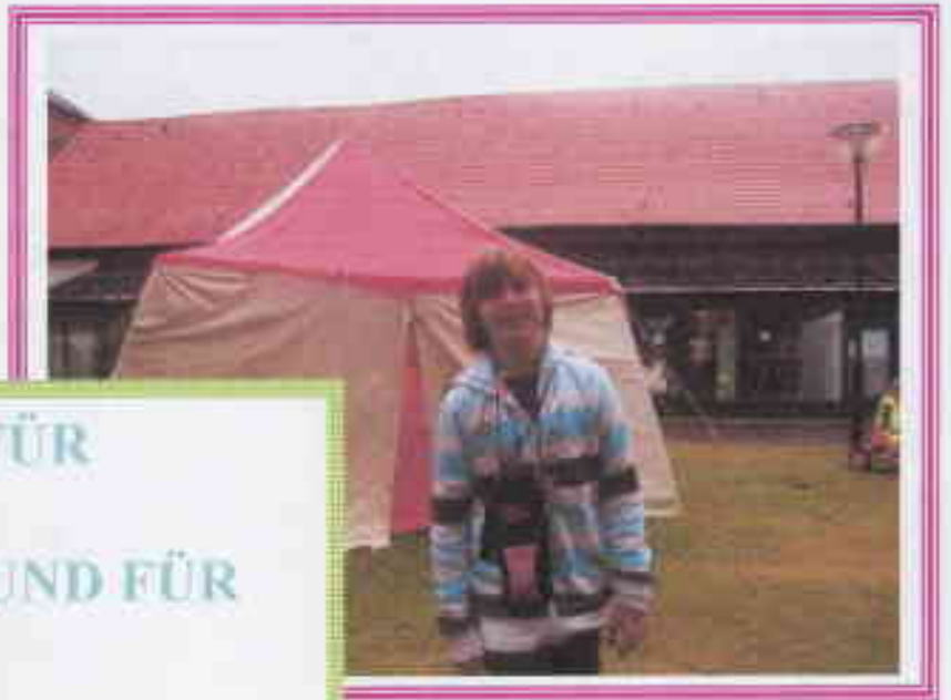
DER LETZTE TAG FÜR JULIUS DEN BÜRGERMEISTER UND FÜR JERRY TOWN.